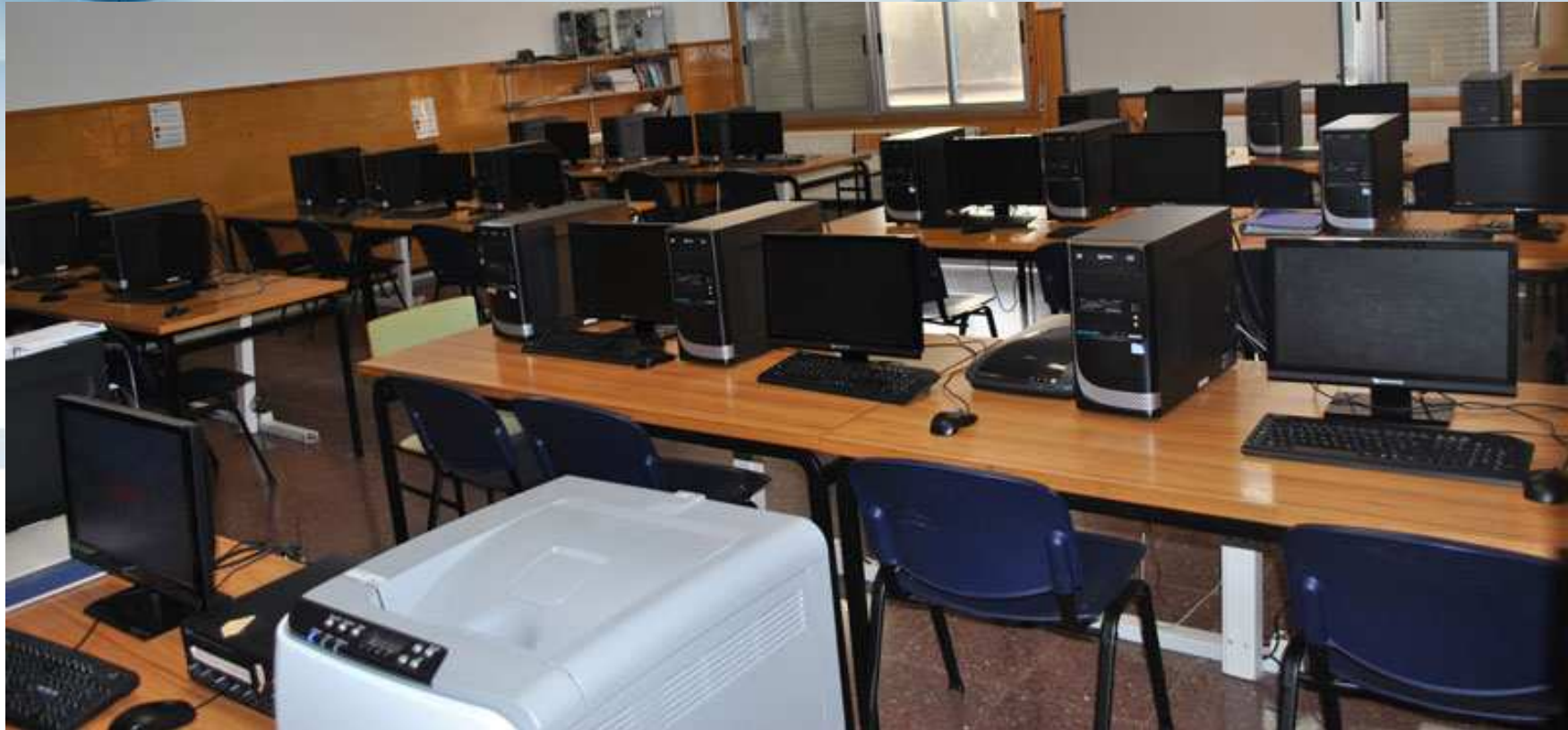
Aula de informática