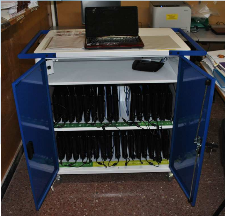
Aula informática móvil