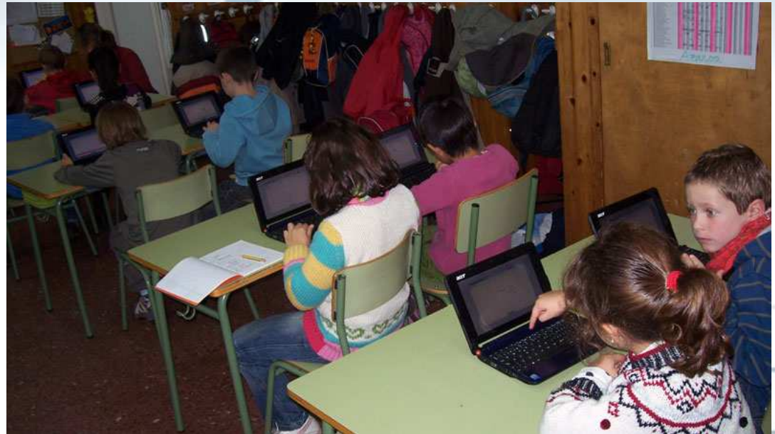
Alumnos trabajando con los portátiles del aula móvil