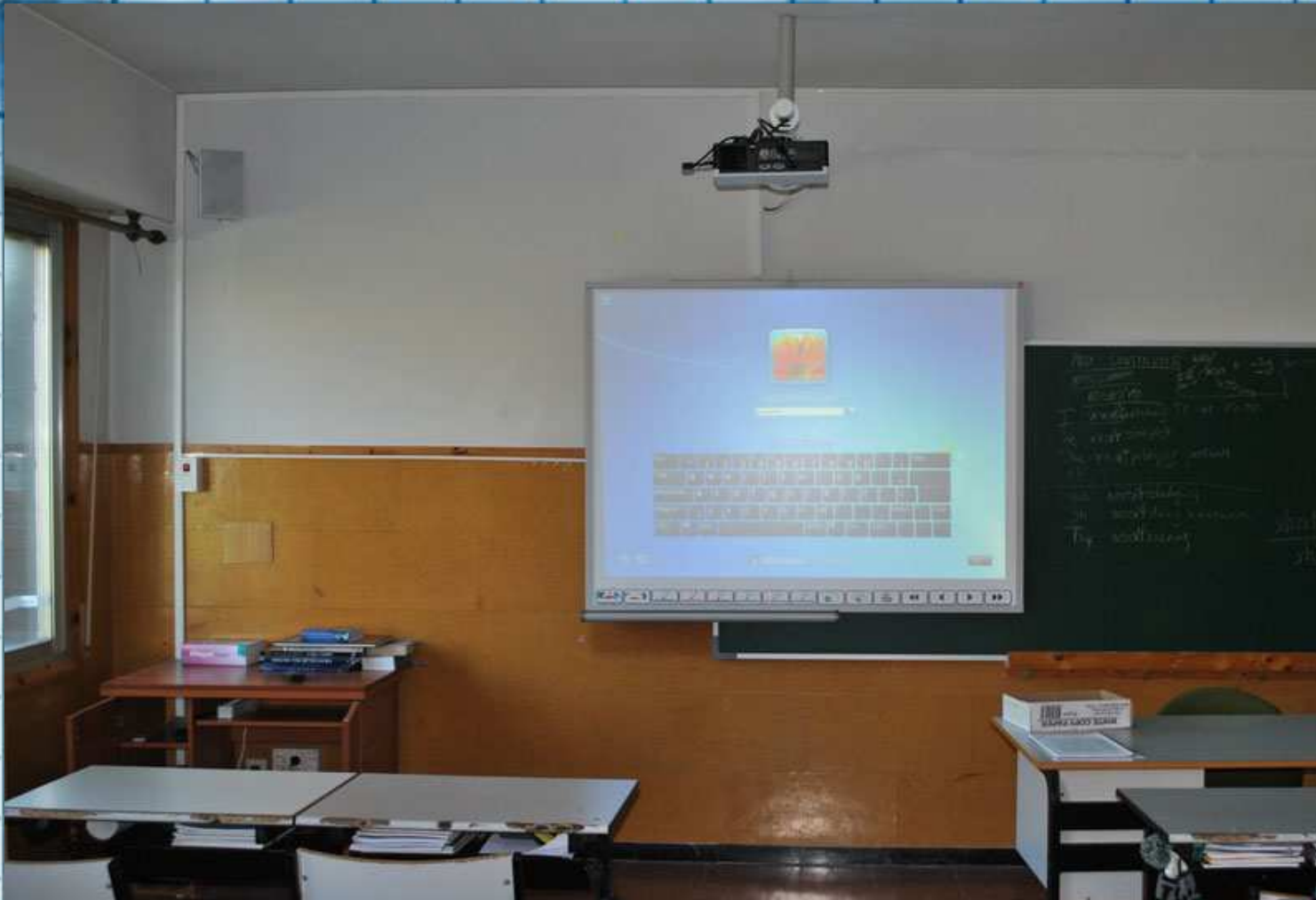
Aula de secundaria con ordenador, proyector y pizarra digital.