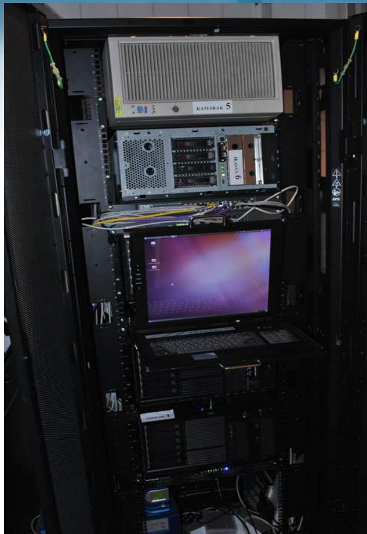
Armario de servidores